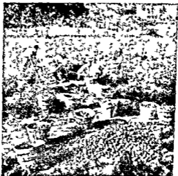
ग्रामदान के बाद पैदावार की बहार